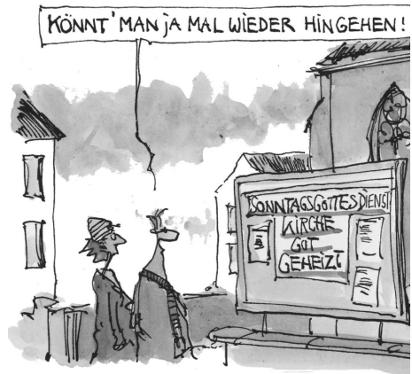
Winterkälte- Krise als Chance